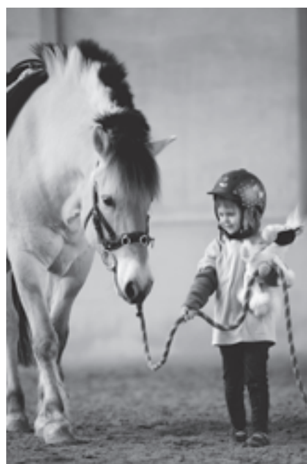
Gerade für Kinder ist Angelo das ideale Therapiepferd